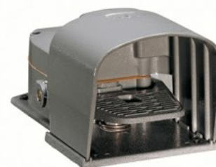
Wyłączniki jednopedałowe. Ze swobodnym uruchamianiem - z osłoną KR200